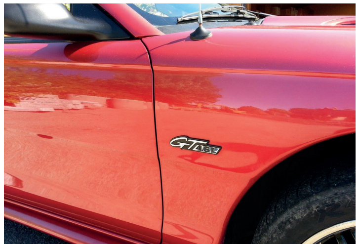
Påfør et tynt lag på alle flater og poler av etter nødvendig virketid!