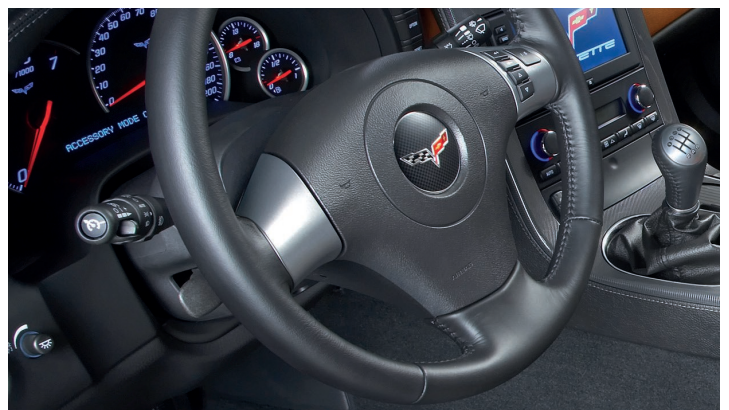
Utmerket for bruk på bilinteriør i skinn, plast, metall og gummi!